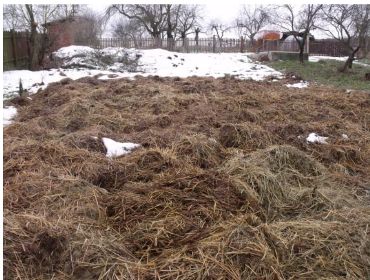
A MÉLYMULCCSAL TAKART FÖLD

Ennek a kétféle megoldásnak a létét megkívánja a növények ültetése is. Sokan nem tudják elképzelni, hogy lehet ebbe a tekintélyes vastagságú mulcsba magokat, növényeket ültetni. A mélymulcs azonban kiválóan alkalmas gumók, palánták, sőt nagyobb magvak ültetésére is. A burgonya gumója harminc centiméter mélyre kerül a mulcsba tavasszal, anélkül, hogy a talajjal érintkezne. A felszedésig, amit itt szó szerint kell érteni, több gondoskodást már nem is igényel, itt ha akarnánk sem tudnánk kapálni, vagy töltegetni. A növény viszont meghálálja a laza mulcsot, és kellő nedvességet. Az uborka, paradicsom, paprika, káposztafélék, zeller palántái, torma hajtása, stb. ugyancsak a mélymulcsba kerülnek elültetésre.