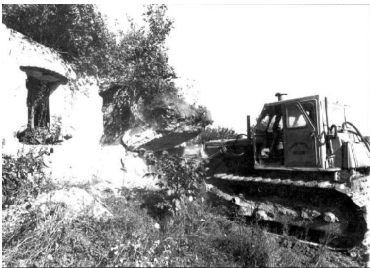
1986. évi 4. szám