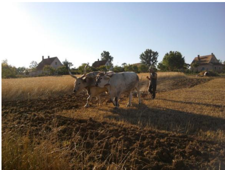
SZÁNTÁS ÖKÖRREL KRISNA-VÖLGYBEN

Lehet, hogy eszményinek, elérhetetlennek, vagy idejétmúltnak tűnő vállalkozás ez a XXI. század elején. Ám ha megvizsgáljuk, hogy melyek az ember alapvető anyagi szükségletei, akkor már korántsem olyan elrugaskodott az elképzelés.