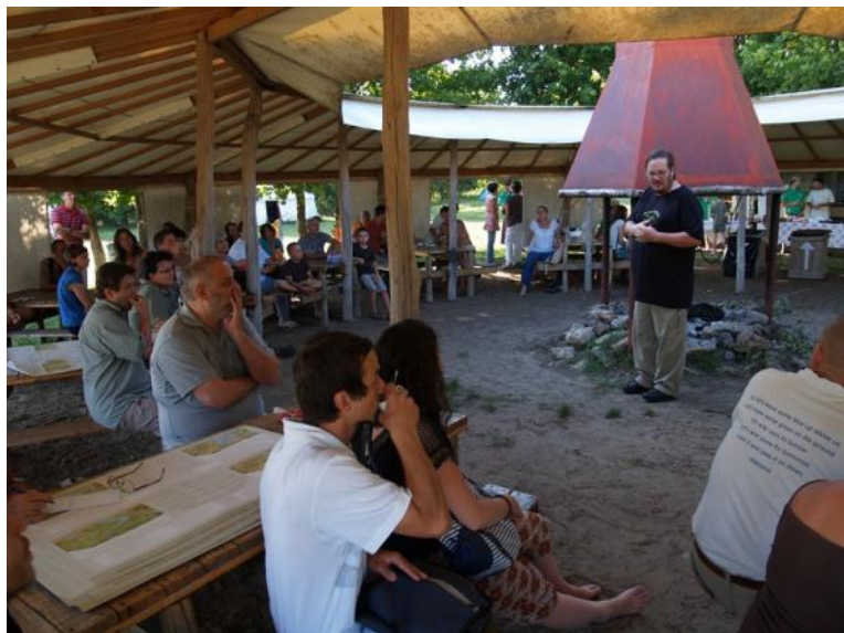
A 2014. NYÁRI ÉLŐFALU TALÁLKOZÓ ÓPUSZTASZEREN