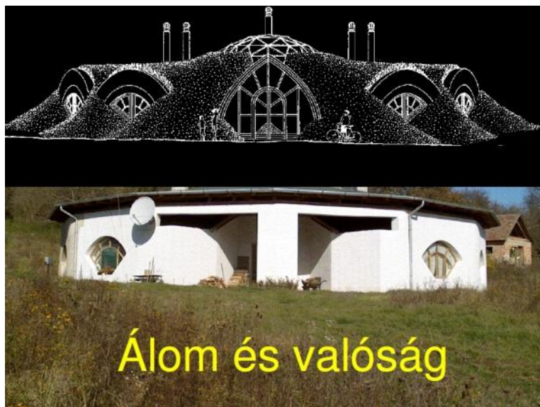
A GYÚRÓFŰI KÖZÖSSÉGI HÁZ A TERVEKEN ÉS A VALÓSÁGBAN

nek legismertebb terméke a kommunista sajtórabaságot kikacagó, havonként pár százas példányszámban megjelenő Lev-Lap című kiadvány volt. A helyzet külön érdekeségeként: a Lev-Lapot a kommunista tigris meglovgolásával, a korabeli nagy társadalmi szervezetek postájával postázták: a szervezők egyszer egy művelődési ház, egyszer a Kommunista Ifjúsági Szövetség (KISZ), egyszer a Hazafias Népfront postázandói közé csempészték be a pár száz példányban szétküldendő hírle-