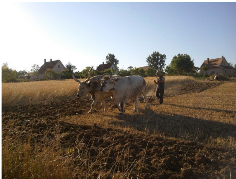
SZÁNTÁS ÖKÖRREL KRISNA-VÖLGYBEN

Lehet, hogy eszményinek, elérhe- tetlennek, vagy idejétmúltak tűnő vállalkozás ez a XXI. század elején. Ám ha megvizsgáljuk, hogy melyek az ember alapvető anyagi szükségle- tei, akkor már korántsem olyan elrugaskodott az elképzelés.