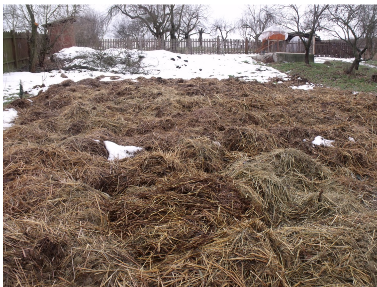
A MÉLYMULCCSAL TAKART FÖLD

Ennek a kétféle megoldásnak a létét megkívánja a növények ültetése is. Sokan nem tudják elképzelni, hogy lehet ebbe a tekintélyes vastagságú mulcsba magokat, növényeket ültetni. A mélymulcs azonban kiválóan alkalmas gumók, palánták, sőt nagyobb magvak ültetésére is. A burgonya gumója harminc centiméter mélyre kerül a mulcsba tavasszal, anélkül, hogy a talajjal érintkezne. A felszedésig, amit itt szó szerint kell érteni, több gondoskodást már nem is igényel, itt ha akarnánk sem tudnánk kapálni, vagy töltegetni. A növény viszont meghálálja a laza mulcsot, és kellő nedvességet. Az uborka, paradicsom, paprika, káposztafélék, zeller palántái, torma hajtása, stb. ugyancsak a mélymulcsba kerülnek elültetésre.