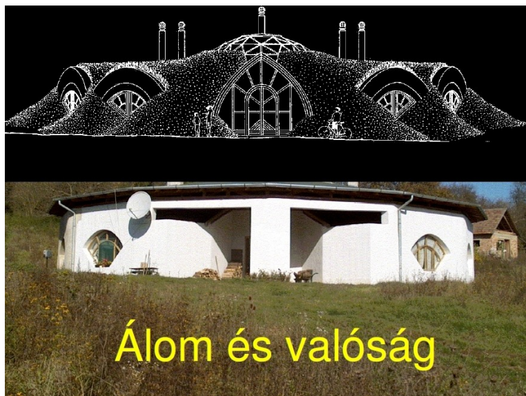
A GYŰRŰFŰI KÖZÖSSÉGI HÁZ A TERVEKEN ÉS A VALÓSÁGBAN

nek legismertebb terméke a kommunista sajtórabaságot kikacagó, havonként pár százas példányszám-ban megjelenő Lev-Lap című kiadvány volt. A helyzet külön érdekes-ségeként: a Lev-Lapot a kommunista tigris meglovaglásával, a korabeli nagy társadalmi szervezetek postájával postázták: a szervezők egyszer egy művelődési ház, egyszer a Kommunista Ifjúsági Szövetség (KISZ), egyszer a Hazafias Népfront postázandói közé csempészték be a pár száz példányban szétküldendő hírle-