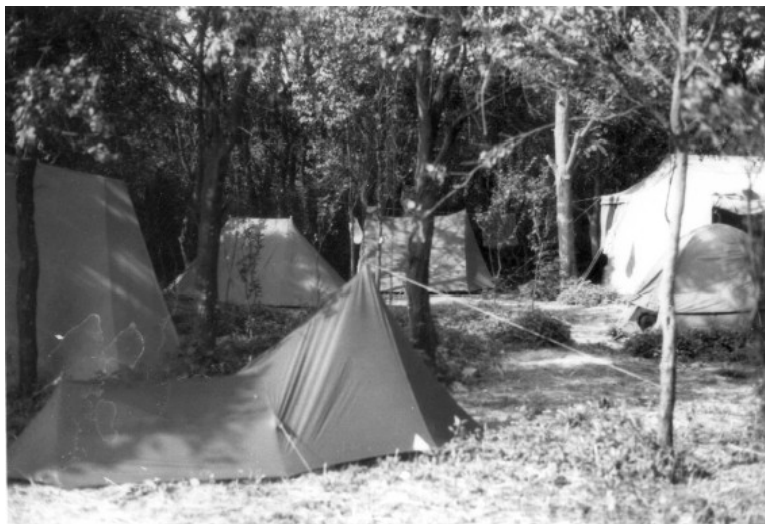
KÖZÖSSÉGI HÁZ ÉPÍTŐ TÁBOR, 1992

A dolognak a kilencvenes évek elején különös aktualitást adott a