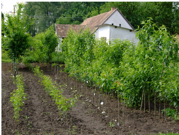
ÖNKORMÁNYZATI GYÜMÖLCSFA CSEMETEKERT MARKÓCON

roni kékfrank képében már régóta létezik). A tanácskozás kérdései között egy oda nem illő kérdést is megvitattak: egy ökológikus területfejlesztési és -szervezési szövetség létrehozását. Ezt a „magyar” előtaggal kiegészítve MÖTSZSZ-nek rövidíthetnék, amit magyar fül, lélek és ajak csakis a teljes hasonulás szabályainak figyelembe vételével, vagyis MÖCCC-nek olvashat ki, és a hevenyészett terminológiai vita eredményeképpen ugyanezt javasolták írásos formának is.