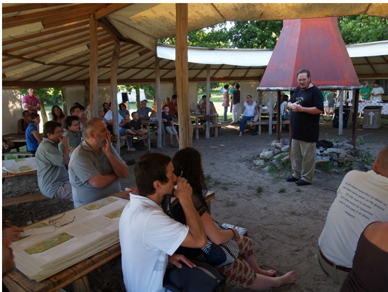
A 2014. NYÁRI ÉLŐFALU TALÁLKOZÓ ÓPUSZTASZEREN

kon. Később, 2004-ben Máriahalom is csatlakozott, majd 2008-ban a nagyszékelyi kezdeményezés, aztán a Géczy Gábor mozgatta Magfalva, majd 2011-ben a Szeri Ökotanyák Szövetsége, a SZÖSZ. Mindazonáltal folyamatosan nőtt a témák iránt érdeklődő, közösségi kezdeményezésekhez nem, vagy csak nagyon lazán kötődő emberek száma is. Kb. 10 éve egy-egy találkozó tipikusan 2-3 tucatnyi embert vonzott, akiknek talán a fele az öko- és élőfalvakból jött, és a másik fele pedig érdeklődő volt – beleértve ismert szakembereket és barátainkat is, és esetlegesen a témával éppen csak ismerkedő zöldfüلűeket is.